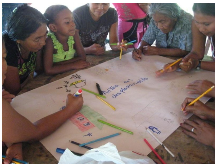
Imagen 4. Mujeres de Membrillal, pensando el pasado, presente y futuro. Foto tomada por Ana Salcedo, Mayo de 2011.

Retomando el debate teórico, las identidades son múltiples y el contexto influye sobre ellas, es así como existe el anhelo de los equipamientos propios de lo urbano. Sin embargo, con respecto a las casas que esperan obtener hay una diferencia importante que da razón de un cambio cultural además de los ya mencionados recogidos en la caracterización realizada por la U. Tecnológica. En el resguardo del barrio Chino de Gambote aún se percibe el deseo de una titulación colectiva de la tierra, dibujan áreas comunales y están a la espera de reivindicaciones por su condición de indígenas, a la vez que él Capitán excluye de sus luchas a los mestizos.