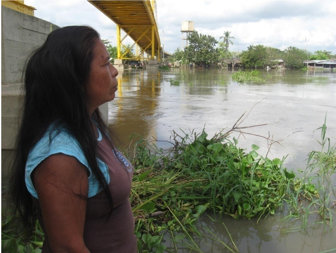
Imagen 1. “Recordando la tierra”, Septiembre 2001, Municipio de Arjona.