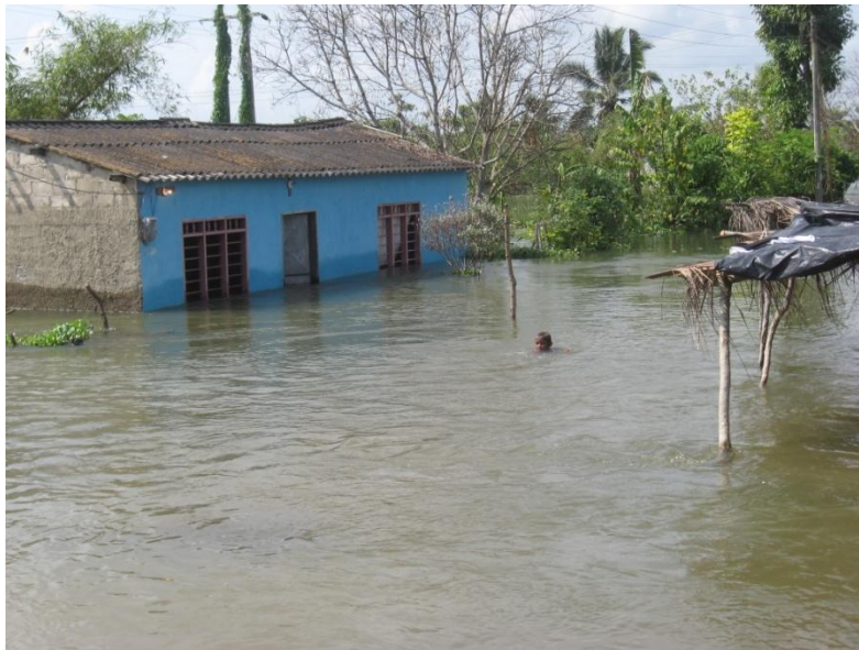
Imagen 4. “El río se llevó mi casa con la inundación” . Gambote. Noviembre de 2010.

Ante la actividad de dibujar lo presente, su cotidiano, ellas, sin excepción en los dos resguardos, dibujaban sus casas mojadas, la pérdida de enseres y reflejaban la tristeza del momento. Por ser el hogar el ámbito femenino más representativo, probablemente para ellas marcó su presente. Sumado a que son familias desplazadas. Sobre este asunto las mujeres no dijeron nada en las entrevistas y solo comentarios vagos en las charlas, la importancia se evidenció en el ejercicio cartográfico.