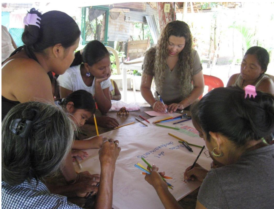
Imagen 7. Trenzando sueños. Imagen 8. Soñando juntas; fotos tomas por Mayerlin, mujer participante en la investigación.