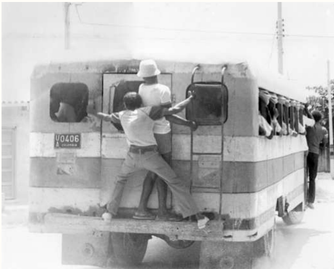
Uno de los buses típicos de los barrios populares de Cartagena

La idea de las chivas rumberas también es muy musical, ¿no creen? Hoy estas chivas hacen parte de las atracciones turísticas más típicas de Cartagena. Surgieron a raíz de los elementos identitarios de los viejos y coloridos buses que prestaban su servicio en barrios como el nuestro. En una época de crisis, un hombre en Manga tuvo la idea de reconvertirlos y allí surgió la primera chiva. Muchos en Cartagena se sumaron a la iniciativa, y en San Francisco sucedió porque el barrio era hogar de conductores, sparrings y parqueaderos nocturnos de muchos de estos buses.