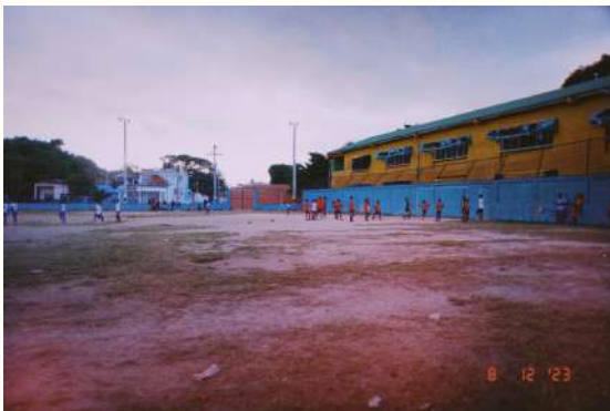
Cancha de fútbol del barrio