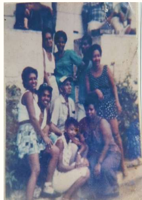
Vecinas y vecinos posando en los años 1990

En nuestro barrio se vive rico y sabroso pese a las problemáticas que nos afectan (la principal de todas es la inseguridad ciudadana, que ha aumentado con el crecimiento descontrolado del barrio). Las parejas se casan y tienen hijos, cuidamos de los pequeños y también cuidamos de nuestros mayores. Intentamos que existan buenas relaciones vecinales, tratando de gestionar adecuadamente los inevitables conflictos que surgen en todos los grupos humanos.