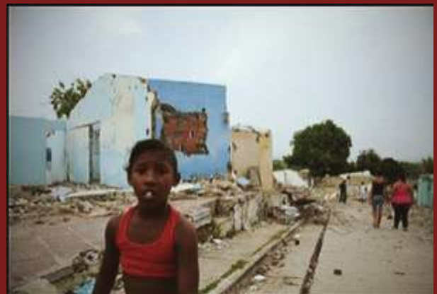
Imágenes de los efectos devastadores de la falla geológica de 2011, tomadas del grupo de Fotos Antiguas de Cartagena (Puello, 2017)