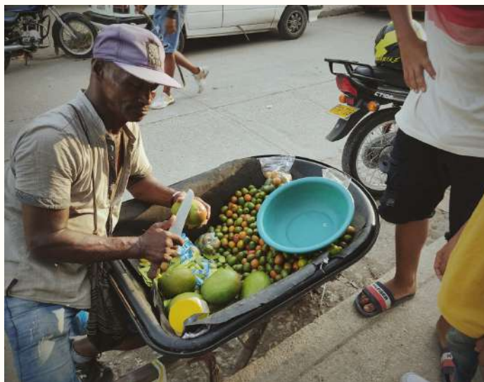
Diversas formas de ganarse la vida en el barrio

En los inicios del barrio muchas personas se ganaban la vida recolectando esa basura y vendiendo a las personas para suministrar alimentos. Recolectaban lo que servía y lo intentaban vender. La parte del reciclaje era una fuente de generación de ingresos que ellos reciclaban plástico. Y la mayoría de hombres de aquí eran albañiles, tenemos carpinteros, electricistas... Casi la mayoría trabajan en la construcción. En esa época aquí no había universidad para estudiar. Otra fuente de ingresos en esa época era la pesca. Como uno tenía cerca la Ciénaga de la Virgen...[...]