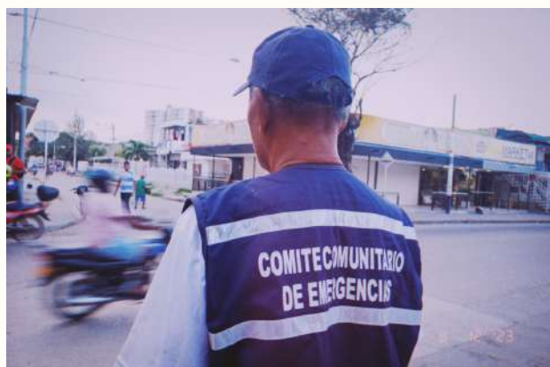
Paseo narrado para el semillero por parte del Comité Barrial de Emergencias COMBAS en agosto de 2023

Yo siento que en el Biblioparque San Francisco puedo sentirme libre y eso no ocurre en otros espacios de Cartagena, aunque tengan el espacio y me lo abran. Es de los pocos espacios donde yo puedo ser lo que soy, sin una máscara. Hay que reconocer que esta es la única biblioteca que asumió el reto y la responsabilidad de combatir ese peso discriminatorio. Otros prefieren ser las bibliotecas clásicas, o de lo que consideramos como de la cultura europea “sofisticada”, y no de la cultura champetúa.