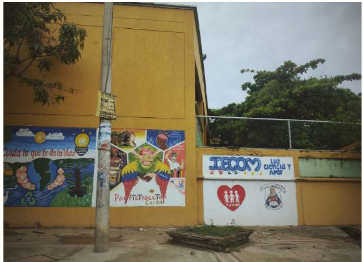
El colegio amarillo

En el barrio hay un puesto de salud, pero cuando hay una emergencia hay que trasladarse al Hospital Universitario del Caribe, en Zaragocilla, que en realidad no está muy lejos en distancia, pero al que se puede llegar a tardar más de 45 minutos según el tráfico.