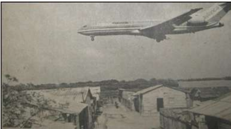
Un Boeing 727 de Avianca a punto de aterrizar sobre la ampliación de la pista a la altura del cercano barrio de San José-Machucha, compartida en el grupo de Facebook (Capella, 2012)

Este aeropuerto se había construido en 1947. En 1982 se amplió la pista de aterrizaje hasta 2.600 metros. En 1983 el motor reactor de un avión hizo que se volaran los frágiles tejaditos de varias casas cercanas, lo que forzó a su desalojo.