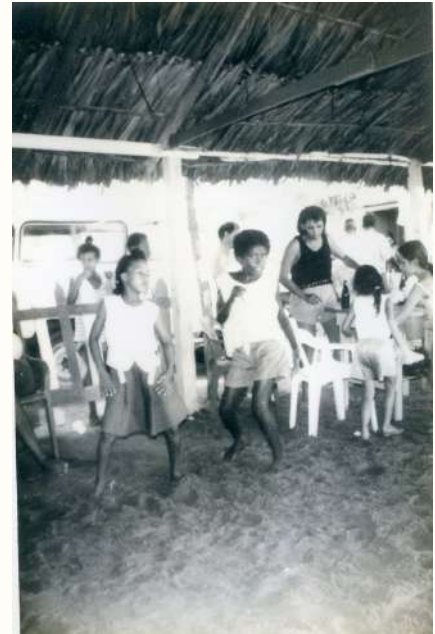
Jóvenes bailando champeta en los años 80

Y luego está la música, que hace parte de la cotidianeidad de San Pacho. Si en otras partes de Cartagena predominaba el vallenato, aquí la salsa fue la reina durante décadas. Todo hacía parte de la cultura picotera, que se refiere a lo que se genera en torno a los picós (del inglés “pickup”):