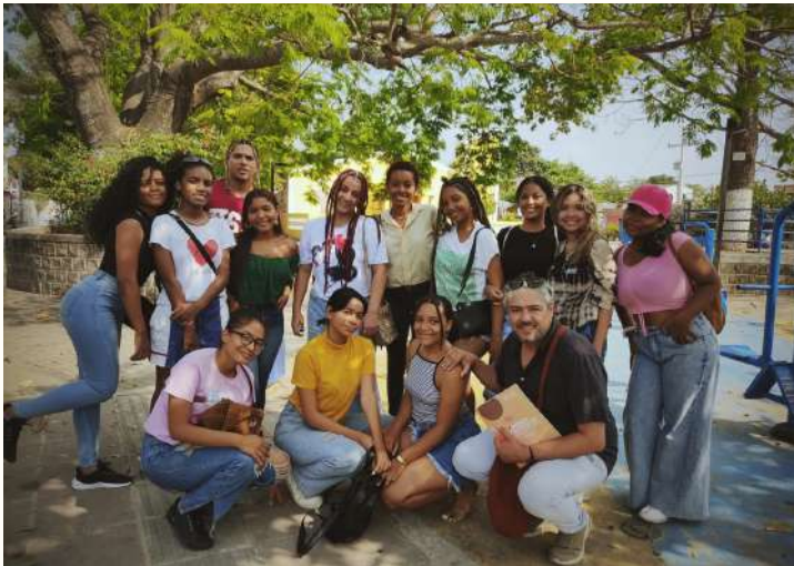
El Semillero de historia de la fotografía en el Caribe colombiano en el Parque de San Francisco en marzo de 2023, a punto de conocer el Biblioparque

El texto que tiene entre sus manos surge de una investigación participativa liderada por el Semillero de investigación en Historia de la fotografía en el Caribe colombiano de la Universidad Tecnológica de Bolívar (UTB) en colaboración con la Fundación Biblioparque del barrio de San Francisco en Cartagena de Indias (Biblioparque San Francisco) y el Museo Histórico de Cartagena (MUHCA). Se inscribe en un proyecto más amplio de este semillero que tiene como horizonte visibilizar y dignificar a las comunidades de los barrios populares de Cartagena de Indias a través de las fotografías que se encuentran en los álbumes de fotos de las familias que los habitan.