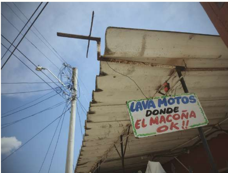
Poste de luz con la telaraña de cables

Creo que el primer servicio que llegó a las casas fue la luz, porque con la luz la gente se va pegando, se va pegando... y así tenían servicio de luz, pero ilegal. Si yo vivía allí y yo tenía mi cable, aquí tú te tirabas y así iba corriendo. Cuando hay invasión, un solo cable que tú ves allá, ves la telaraña. Ahí comenzó el primer servicio. Era pirata. Ahora lo controla más la empresa de electricidad. En el 1976 ya teníamos la luz legalizada (Manuel).