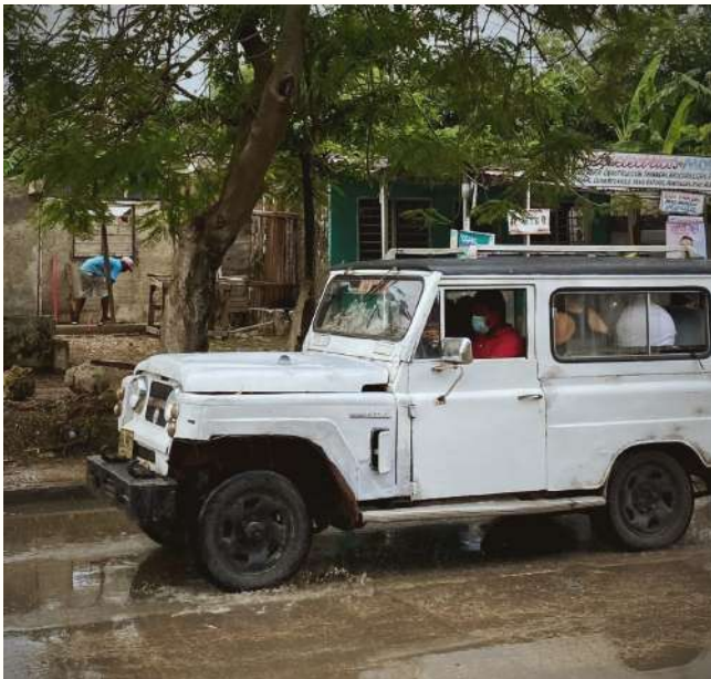
Un “recogelocos” recorre la avenida principal un día de lluvia

También, pasaban busetas que traían consigo picós, equipos de sonido a todo volumen que, por lo general, reproducían canciones de salsa, vallenato, y luego ya la champeta, un género distintivo del barrio. Hoy, y como sucede en toda la Cartagena periférica, el mototaxismo, además de ser un modo de empleo informal, es el medio de transporte más empleado en del barrio porque es lo más económico y rápido, aunque no lo más seguro. La movilidad, fundamental para el desarrollo sociocultural y económico de cualquier población, sigue siendo muy complicada para los vecinos de San Francisco. Aquí aún no ha llegado el Transcaribe, los taxis son cada vez más caros y los pocos buses que prestan servicio van muy lentos.