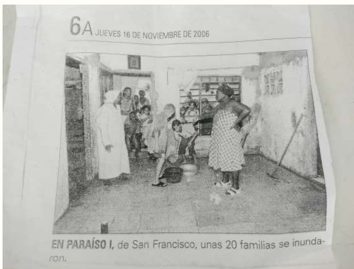
Imagen de un recorte de periódico de 2006 que nos trajo una vecina. Hoy, cada vez que llueve, sigue siendo un problema para muchos hogares