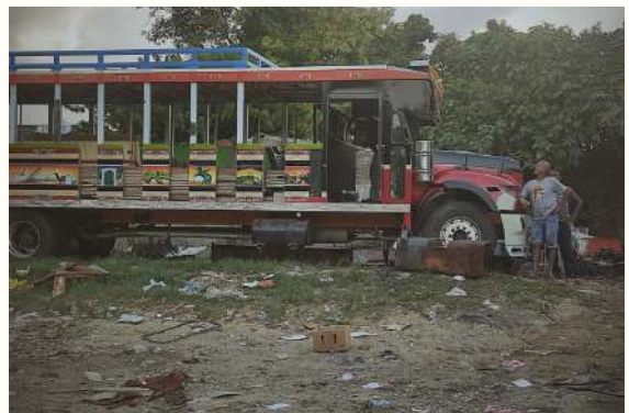
Construyendo una chiva rumbera en 2023 por la Loma del Caracol, en San Pacho

Hoy, con el aumento del turismo que experimenta Cartagena, en el barrio se siguen adecuando viejos buses para convertirlos en chivas.