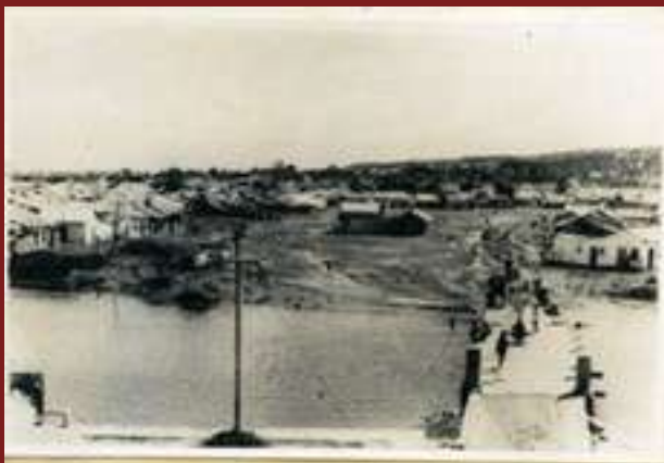
Dos vistas de Chambacú en los años 1940, antes de la erradicación del sector