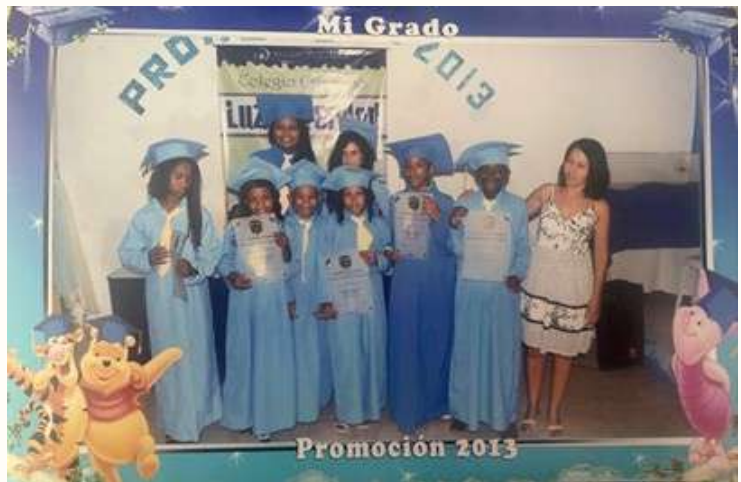
Promoción del 2013 que se graduó de primaria en el Colegio Cristiano Luz y Verdad, (el colegio amarillo) junto con la profe Lurdes