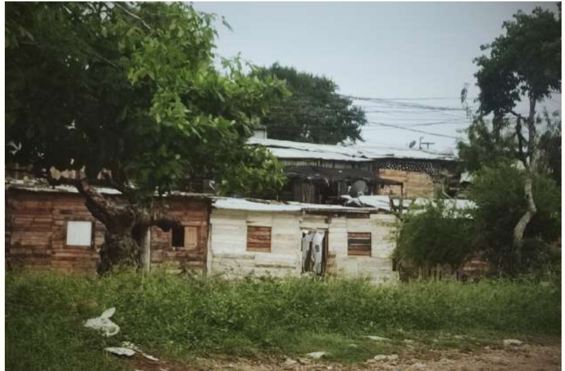
Casas de tablitas de madera y tejado de zinc en el barrio en 2023

Durante una invasión, el acceso a los servicios básicos como el agua, la electricidad o el gas no es nada fácil. Eso implica que durante varios años el llevar una vida digna dependa de la comunidad: