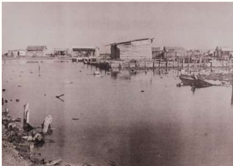
Fotografía tomada por Elkin Mesa en 1973 tomada del grupo de Fotos Antiguas de Cartagena (Deavila, 2021), y que muestra algunas casas de tablitas en la Ciénaga de la Virgen ganándole terreno al agua con los rellenos

En 1964 llegó otra invasión más numerosa, de 665 familias, que se instalaron alrededor de la poza donde hoy está el Centro de Vida, y la tercera invasión fundacional tuvo lugar entre 1965 y 1966 a orillas del Caño Juan Angola.